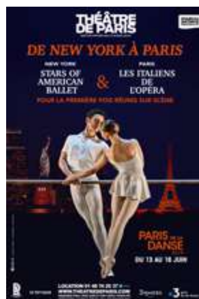
De New-York à Paris Du 13 au 16 juin 2019