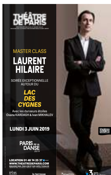
MasterClass Laurent Hilaire Lundi 03 juin 2019