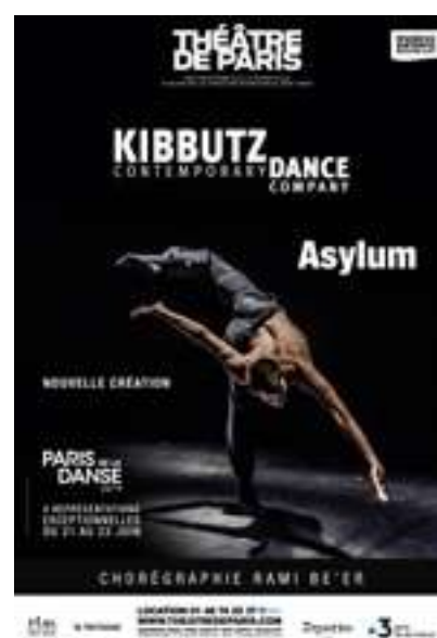
Kibbutz Contemporary Dance company Asylum Du 21 au 23 juin 2019

– RÉSERVATIONS – 01 48 74 25 37 www.theatredeparis.com